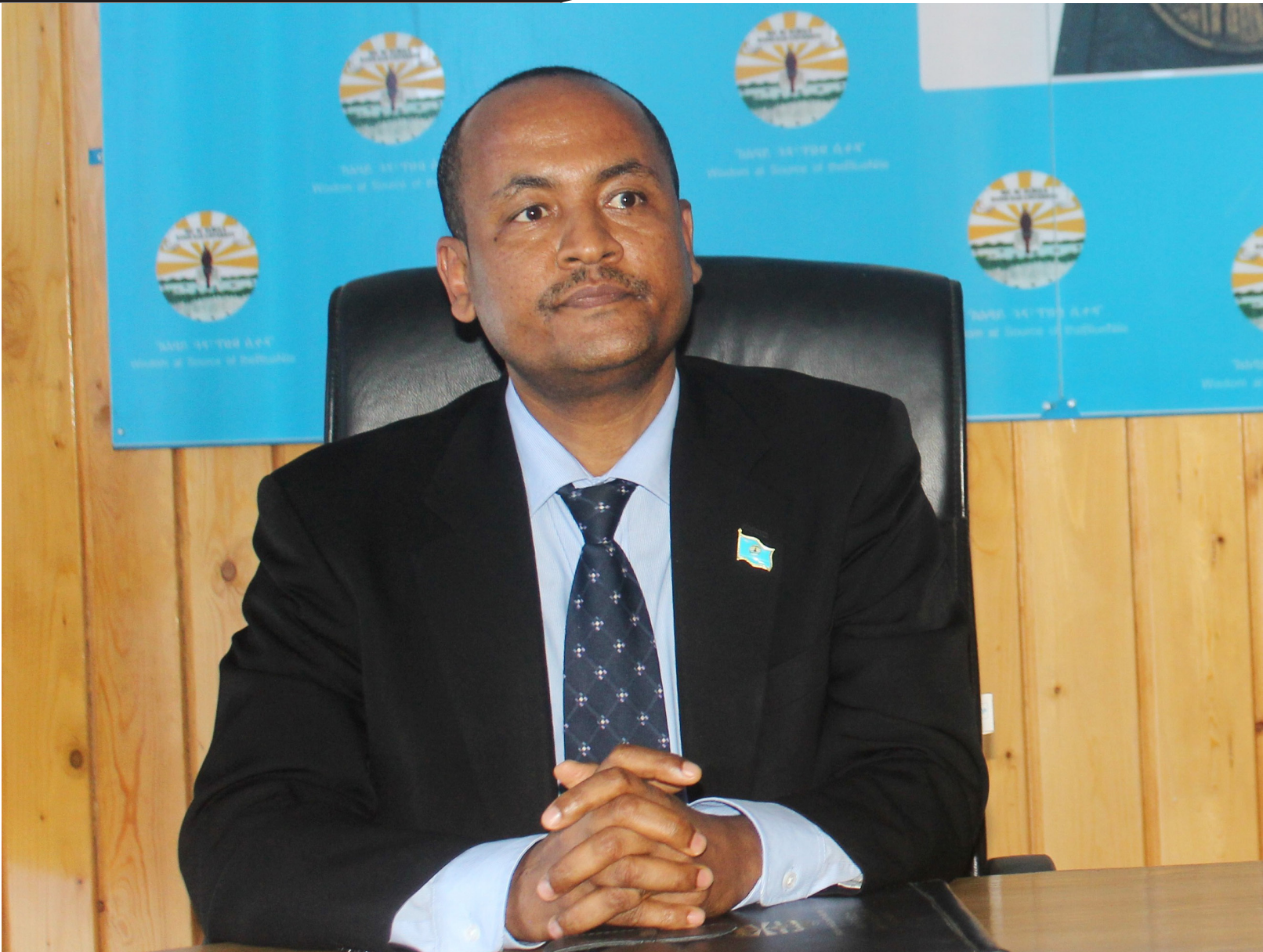
ፍሬው ተገኘ (ዶ/ር) የባሕር ዳር ዩኒቨርሲቲ ፕሬዚዳንት