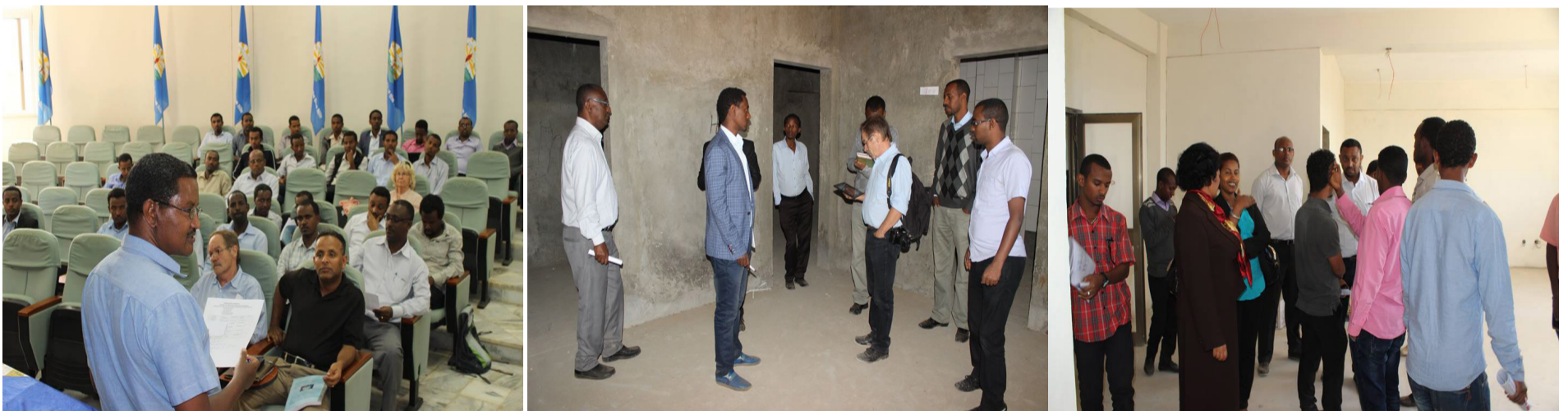
A workshop focusing on BDU's College of Health and Medical Sciences' specialized teaching hospital progress held