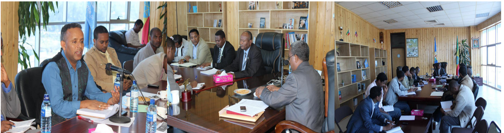
House of People's Representatives Human Resource Standing Committee interacting with BDU top management to discuss on teaching-learning, research and community services activities being undertaken by the university