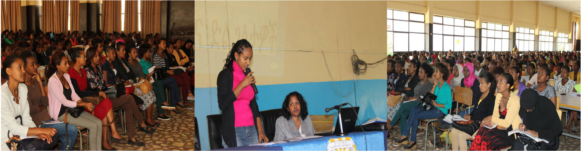
BDU's female students receiving training on the struggle and successes of Ethiopian women in general and the challenges female students faced in the university