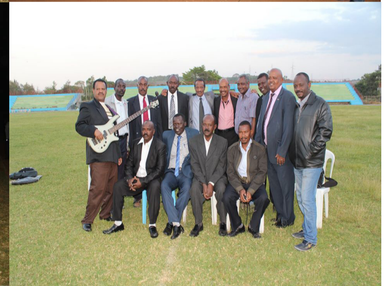
Sudanese cultural team performing modern and traditional Sudanese songs to BDUs' community