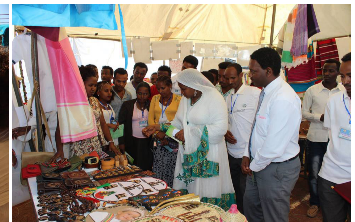
Tourism week celebrated at BDU

እውነትን መፍለግና ስሌሳው ማሳወቅ ማህበራዊ ኃላፊነታችን ይሁን!