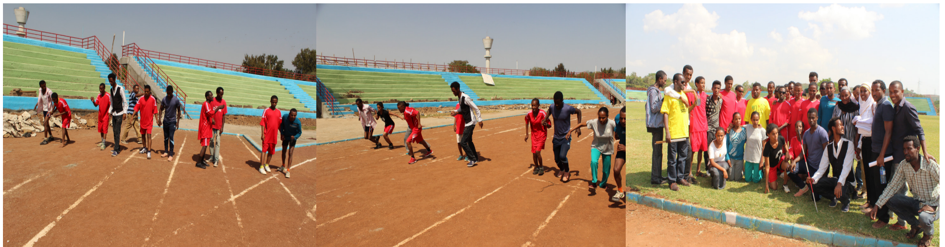
የአካል ጉዳተኞች ቀን በዩኒቨርሲቲው ሲከበር አካል ጉዳተኞች የስፖርት ውድድር ሲያደርጉ