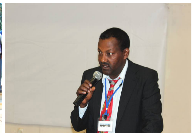
International conference on Tropical lakes ‘TROPILAKES 2015’ held at BDU

“የመምህራን የምርምር ተሳትፎ የአንባሳውን ድርሻ መውሰድ አለበት”