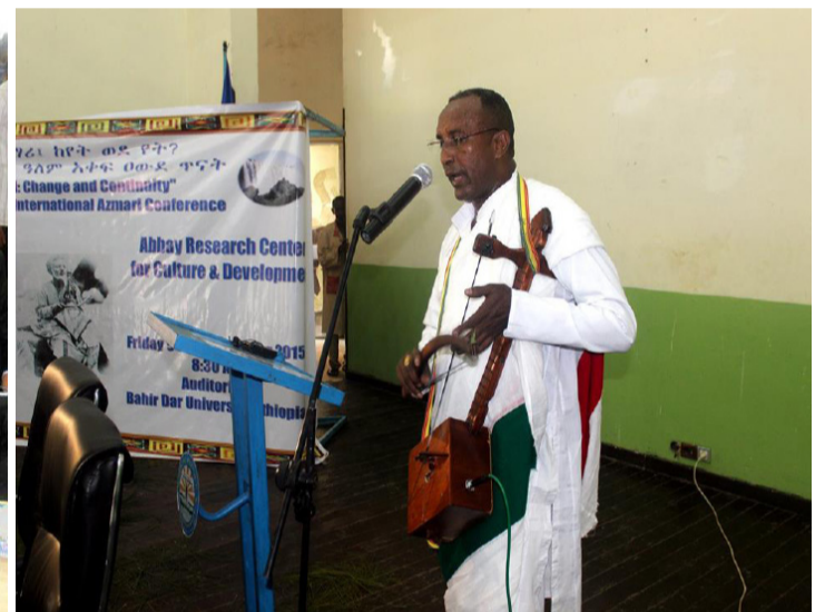
2ተኛው አለም አቀፍ የአገጣጠሚ አውደጥናት “አገጣጠሚ ከየት ወደ የት” በሚል መሪ ቃል በባሕር ዳር ዩኒቨርሲቲ ሲካሄድ