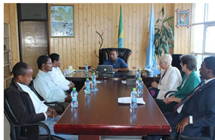
BDU signing agreement with the University of Aberdeen