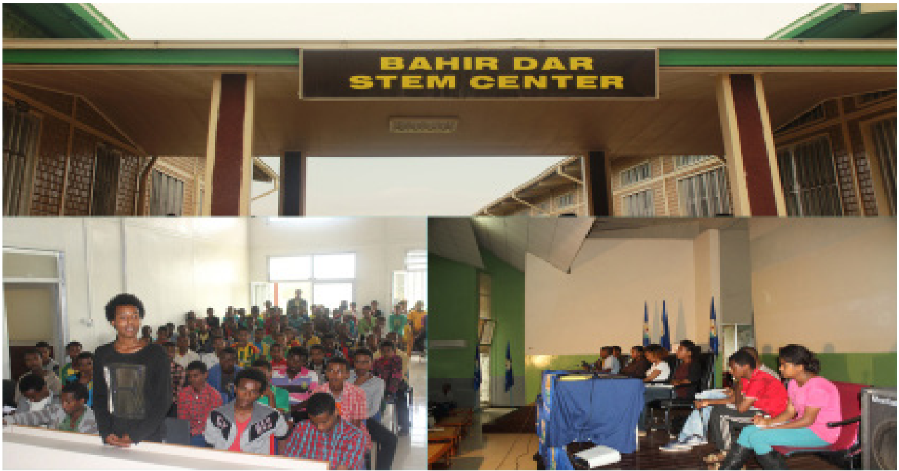
Talented students on STEM training