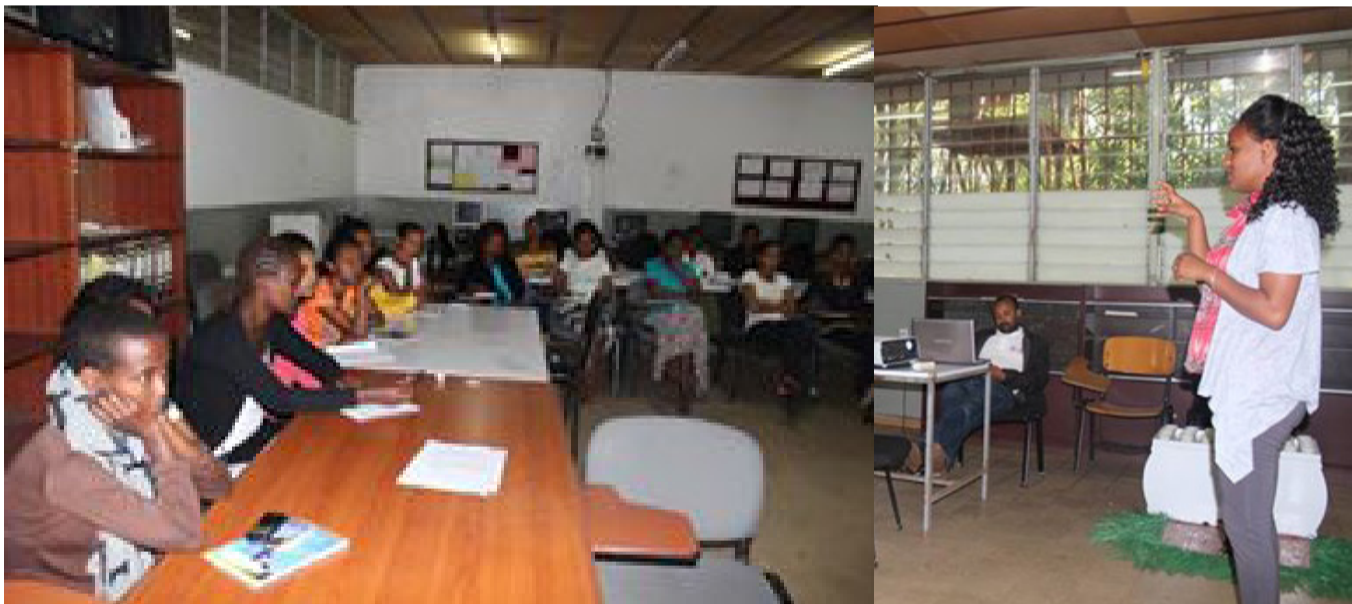
Novice female graduate assistants on training