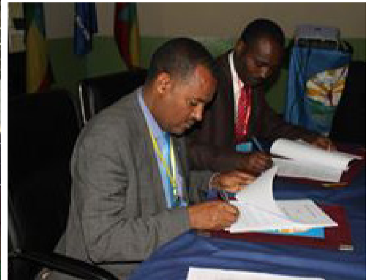
የኢትዮጵያ ስታቲስቲክስ ማህበር ከዩኒቨርሲቲው ጋር የመግባቢያ ስምምነት ሲፈራረም