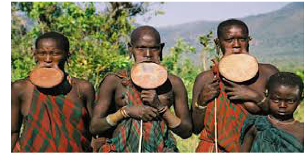
ፎቶ.ቁ1:-የሙርሲ ብሔረሰብ ሴቶች ገፅታ

ይናገራል። ለትንቢያ የሚቀርቡ ህልሞች ከራሱ እና በስልጣን ከሱ በታች ከሆነው ከ“ካሚሲ” የሚመጡ ህልሞችንና ሃሳቦችን ይቀበላል። የታዩና የታለሙ ህልሞችን ለመፍታት ባህላዊ ሥርዓት እንዲዘጋጅ ትእዛዝ ይሰጣል። በተዘጋጀው ሥርዓት የታለሙ ህልሞች (ህልም በመፍታት በተካካው/ኑ ሄርሃቶ/ዎች) ቀርበው ባህላዊና መንፈሳዊ ፍቺ እና ትንታኔ ይሰጣቸዋል። በትንቢቱ መሰረት የሚደረጉ ሥርዓቶች እንዲፈፀሙ መመሪያ ይሰጣል፤ የትንቢቱን ትግበራ ሥርዓት ሂደት ይከታተላል።