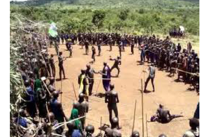
ፎቶ ግ.ቁ2፡- ባህልዊ የ"ዶንጋ" ፍልሚያ ጨዋታ