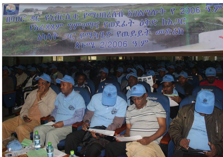
BDU's community celebrating annual Community Service Day